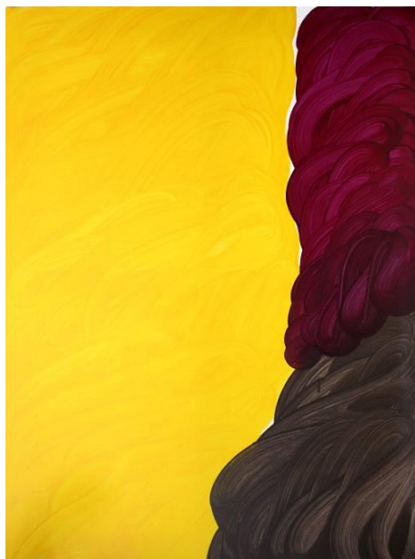
"Sans Titre II" 2012 Acrylique sur toile 100 x 81 cm

"Entremêlées" Exposition du 8 janvier au 2 février 2013 Vernissage le jeudi 10 janvier de 19 à 21 heures