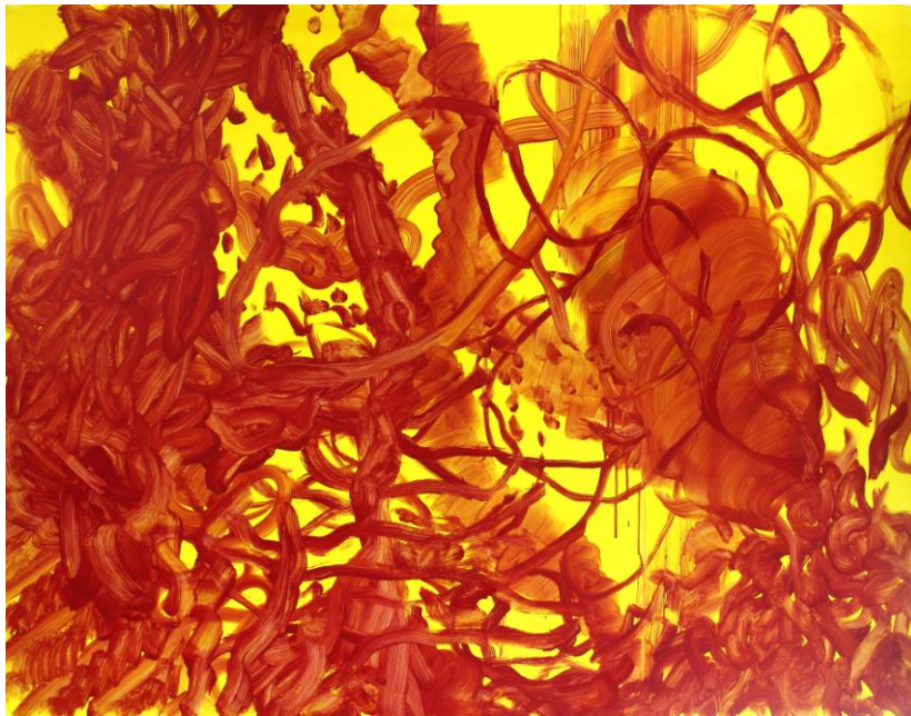
"Dislocation II" 2012 Acrylique sur toile 114 x 146 cm