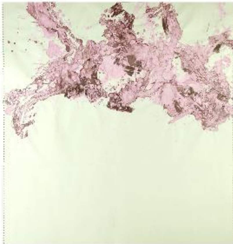
"6 INK 6" 2009. Encres sur papier. 129 x118 cm

1987-1990  cole Estienne. (Arts graphiques. Paris) Graphisme et gravure taille-douce.